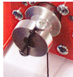
Fig. 1 Fixation du câble